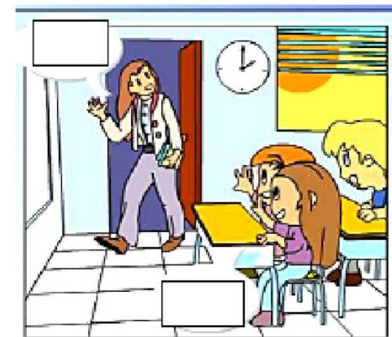
À l'école , 14h00 de l'après-midi !