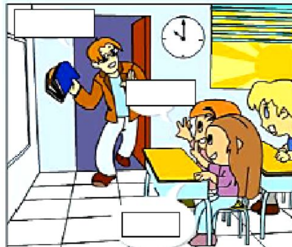
À l'école , 10h00 du matin !