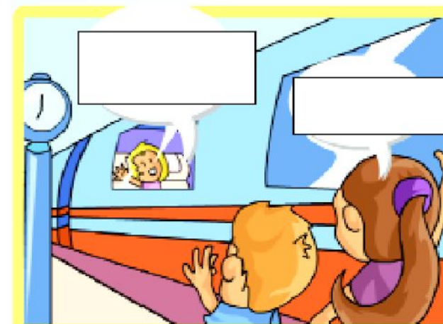
Dans le train.