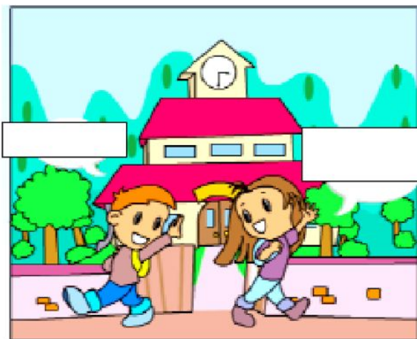
À l'école , 15h30 de l'après-midi.

http://www.learnalberta.ca/content/flbla/html/scenarios/scenario1/index.html?scenario=1&group=7&activity=3&totalactivities=20