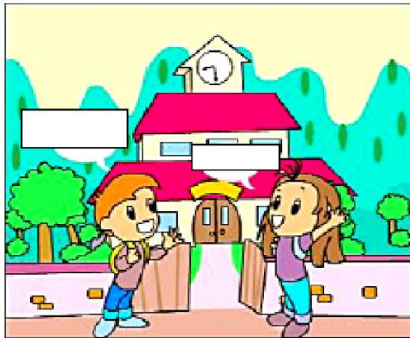
À l'école , 8h30 du matin !

http://www.learnberta.ca/content/fbla/html/scenarios/scenario1/index.html?scenarior=1&group=4&activity=2&totalactivities=20