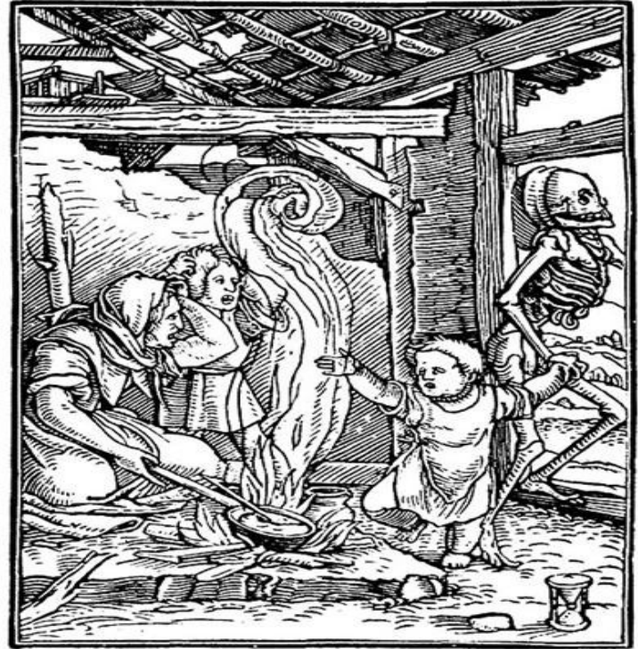
Holbein, Hans. "The Dance of Death."