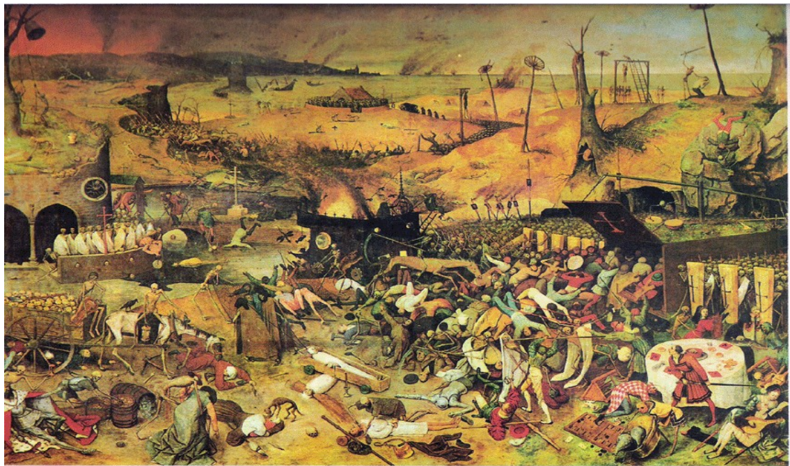
Quadro de Pieter Bruegel (1562) intitulado “O triunfo da morte”, inspirado na peste negra do século XVI. Museu do Prado

Entre os séculos X e XIII, a Europa prosperou devido o crescimento da população e das cidades. Mas, a partir do século XIV iniciou-se uma crise prolongada marcada por fome, doenças e revoltas sociais.