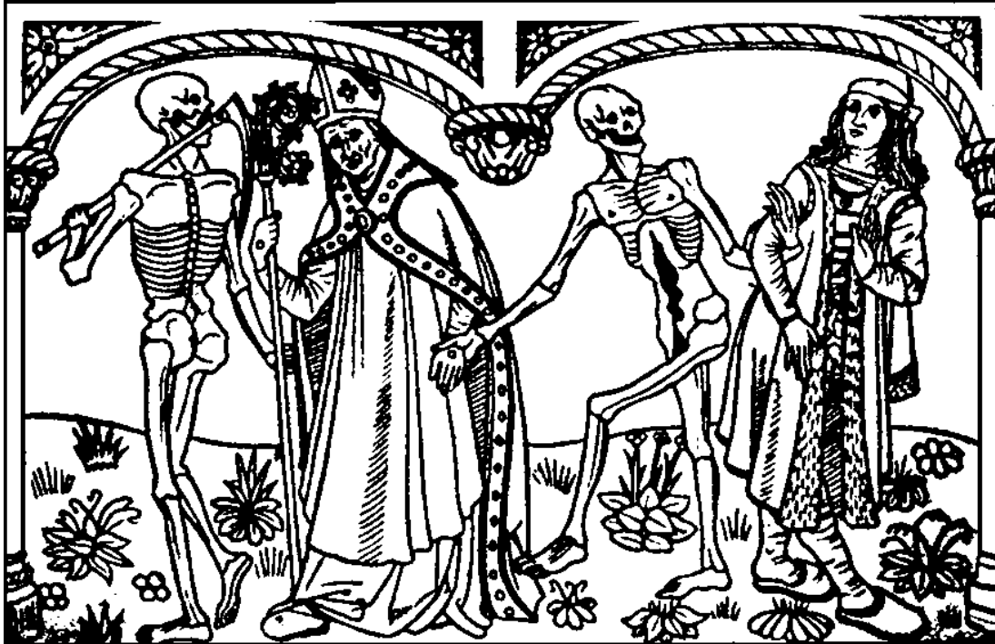
Gravura da edição francesa do poema Danse macabre (Guyot Marchant, 1486)